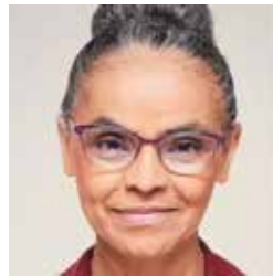
Marina Silva, Ministra de Medio Ambiente de Brasil