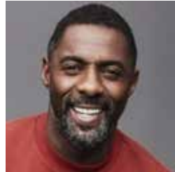
Idris Elba, Empresario, Actor, Músico, Embajador de Buena Voluntad del FIDA de las Naciones Unidas Exteriores de Qatar