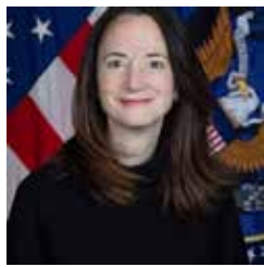
Avril Haines, Directora de Inteligencia Nacional de Estados Unidos