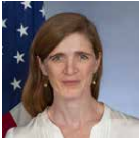
Samantha Power, Directora de USAID

Global Development Innovation Fund: Samantha Power, directora de USAID, anunció la creación en 2023 de un nuevo fondo de desarrollo que tiene como objetivo movilizar nuevos recursos para apoyar proyectos innovadores que aborden los desafíos del desarrollo global ayudando a alcanzar los ODS. El fondo se centrará en áreas clave como: cambio climático, agricultura sostenible, agua limpia y salud global. USAID trabajará con una variedad de socios: ONG's, empresas privadas y organizaciones internacionales para identificar y apoyar proyectos elegibles.