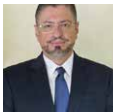
Rodrigo Chaves Robles, Presidente de Costa Rica