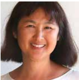
Maya Lin, Arquitecta