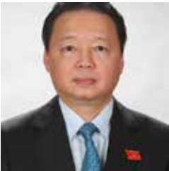
Tran Hong Ha , Viceprimer Ministro y Ministro de Recursos Naturales y Medio Ambiente de Vietnam