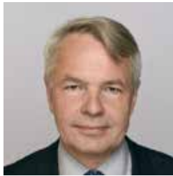
Pekka Haavisto, Ministro de Relaciones Exteriores de Finlandia