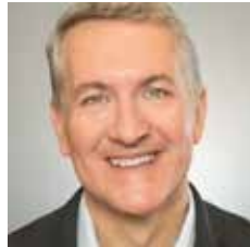
Ramon Laguarta, Presidente y Director Ejecutivo de PepsiCo Inc.