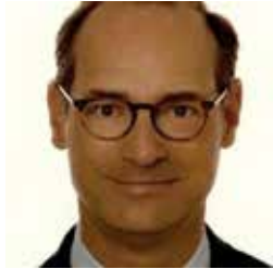
Oliver Bäte, Director Ejecutivo de Allianz SE