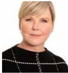
Anne Beathe Tvinneim, Ministra de Desarrollo Internacional de Noruega