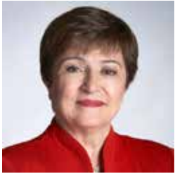
Kristalina Georgieva, Directora Gerente del Fondo Monetario