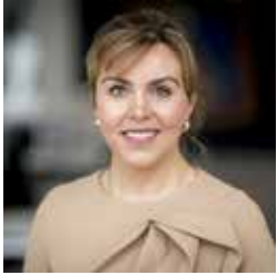
Vivianne Heijnen, Ministra de Ambiente de Países Bajos