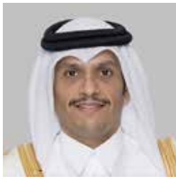
Mohammed Bin Abdulrahman Al Thani, Viceprimer Ministro y Ministro de Relaciones Exteriores de Qatar