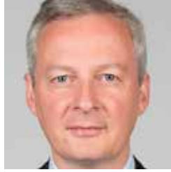
Bruno Le Maire, Ministro de Economía en Francia