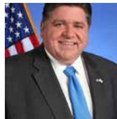
JB Pritzker, Gobernador del Estado de Illinois