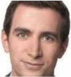
Andrew R. Sorkin, Editor General y Columnista de The New York Times