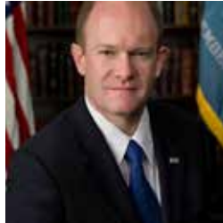
Christopher A. Coons, Senador de Delaware