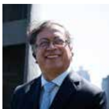
Gustavo Francisco Petro Urrego, Presidente de Colombia