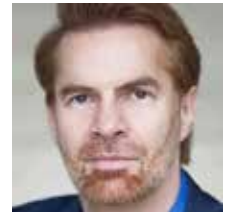
Erik Brynjolfsson, Profesor y Miembro Senior del Instituto de AI Centrado en el Ser Humano de Stanford