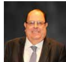
Julio Velarde, Governador del Banco Central del Perú