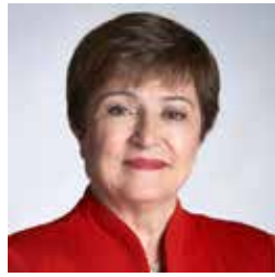
Kristalina Georgieva, Directora Gerente del Fondo Monetario Internacional