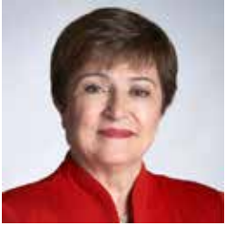
Kristalina Georgieva, Directora Gerente del Fondo Monetario