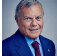
Sir Martin Sorrell, Presidente Ejecutivo de S4Capital plc