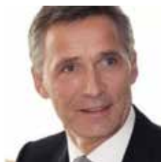
Jens Stoltenberg, Secretario General de la Organización del Tratado del Atlántico del Norte (OTAN)