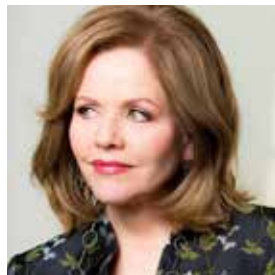
Renée Fleming, Soprano