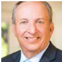
Lawrence H. Summers, Economista y Ex-Presidente del Banco de la Reserva Federal de Estados Unidos