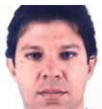
Fernando Haddad, Ministro de finanzas de Brasil