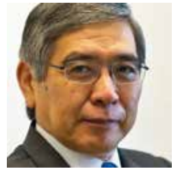
Kuroda Haruhiko, Governador del Banco de Japón