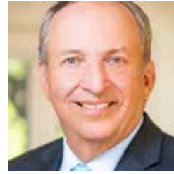
Lawrence H. Summers, Economista y Ex-Presidente del Banco de la Reserva Federal de Estados Unidos