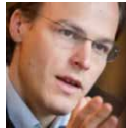
Batién Girod, Miembro del National Council del Parlamento Suizo