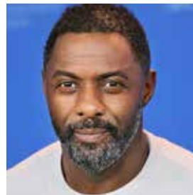
Idris Elba, Actor - Cineasta