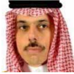
Príncipe Faisal bin Farhan Al Saud, Ministro de Relaciones Exteriores de Arabia Saudita