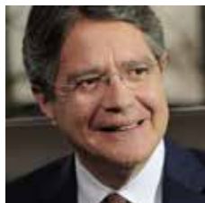
Guillermo Lasso Mendoza, Presidente de Ecuador