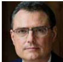
Thomas J. Jordan, Presidente del Consejo de Administración del Banco Nacional de Suiza