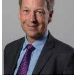
Jakob Stausholm, Director Ejecutivo de Rio Tinto Plc