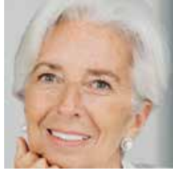
Christine Lagarde, Presidenta del Banco Central Europeo