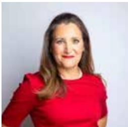
Chrystia Freeland, Viceprimer Ministra y Ministra de Finanzas de Canadá