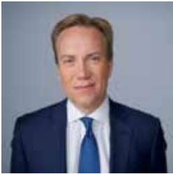
Børge Brende, Presidente de WEF