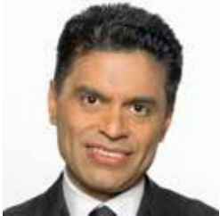
Fareed Zakaria CNN