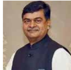
Raj Kumar Singh, Ministro de Poder de India